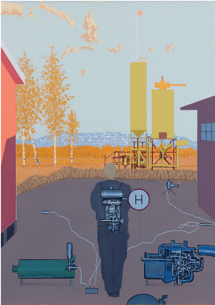
Scene i ettermiddagslyset (detalj), 2018-2020 Privat samling