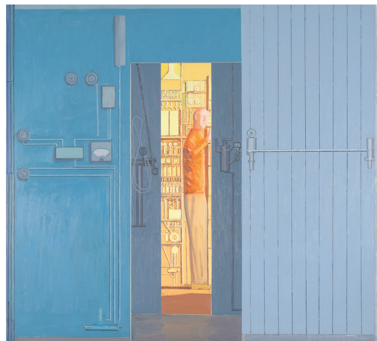
Tenksom figur i lampelys, 2007–2009 Nasjonalmuseet, Oslo.

motivkrets på et tematisk plan. Det elektriske lampelyset peker på industrisamfunnets energibehov, og elektrisiteten går som en strøm gjennom hele hans kunstnerskap. Maleriene er fulle av høyspentmaster, kraftstasjoner, ledninger og elektriske koblinger – slik figuren i lampelyset her står omgitt av en el-tavle med sikringer og transformatorer, kabler og koblingspunkter som strekker seg fra det ene rommet til det neste.