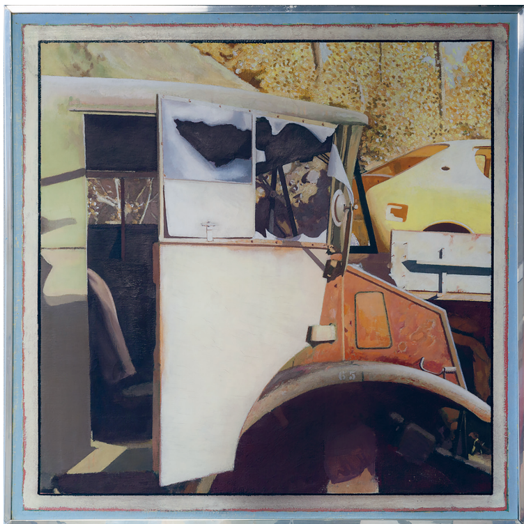
Bilvrak i høstsol, 1973–1974 Oslo kommunes kunstsamling.