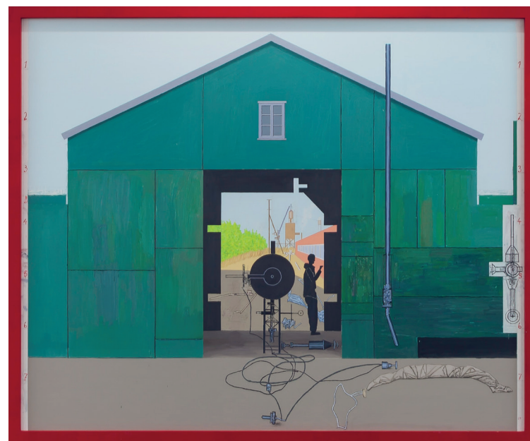
I ettermiddagslyset, 2015–2016 Astrup Fearnley-samlingen

og aktiviteten på innsiden, peker maleriene også mot at noe foregår bortenfor vår persepsjon; også nede i jorden og i mørket bak gardinene.