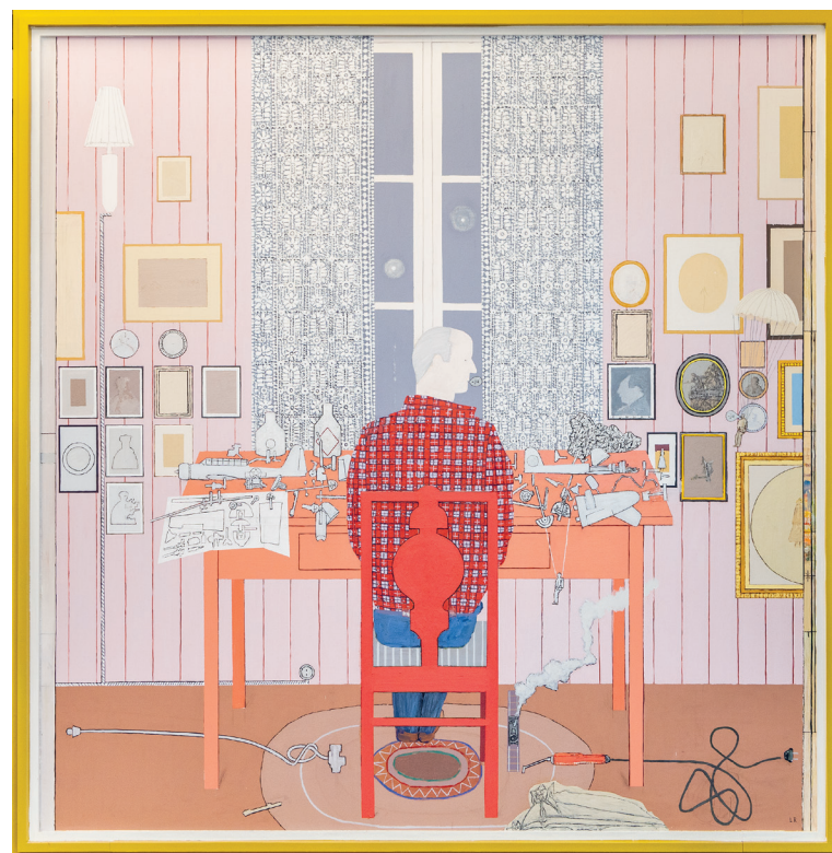
Tenksom modellflybygger, 2019–2023 Astrup Fearnley-samlingen

I dette rommet vises også et utvalg hodemotiver fra 1980-tallet. Sammenstillingen med modellflybyggeren, som i noen av maleriene er fremstilt med hodet løsrevet fra kroppen, peker på et psykologisk aspekt ved motivkretsen. I noen av bildene er hodet knyttet til omgivelsene, eller til resten av kroppen, med ledninger og koblinger. I andre verk er hodet fremstilt som et slags diagram eller kart. Kanskje kan man her snakke om en opptegning, ikke bare av en ytre virkelighet, men av menneskets indre: Både fysiske prosesser i kroppen og hjernen, men også noe sjelelig; en kartlegging av menneskesinnets tanker og mentale assosiasjoner.