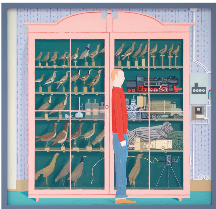
Figur mot rødt fugleskapp, 2007 Astrup Fearnley-samlingen.

naturen, og samtidig kanskje på den antropocene tidsalderen hvor menneskelig aktivitet nå bidrar til å redusere artsmangfoldet på planeten.