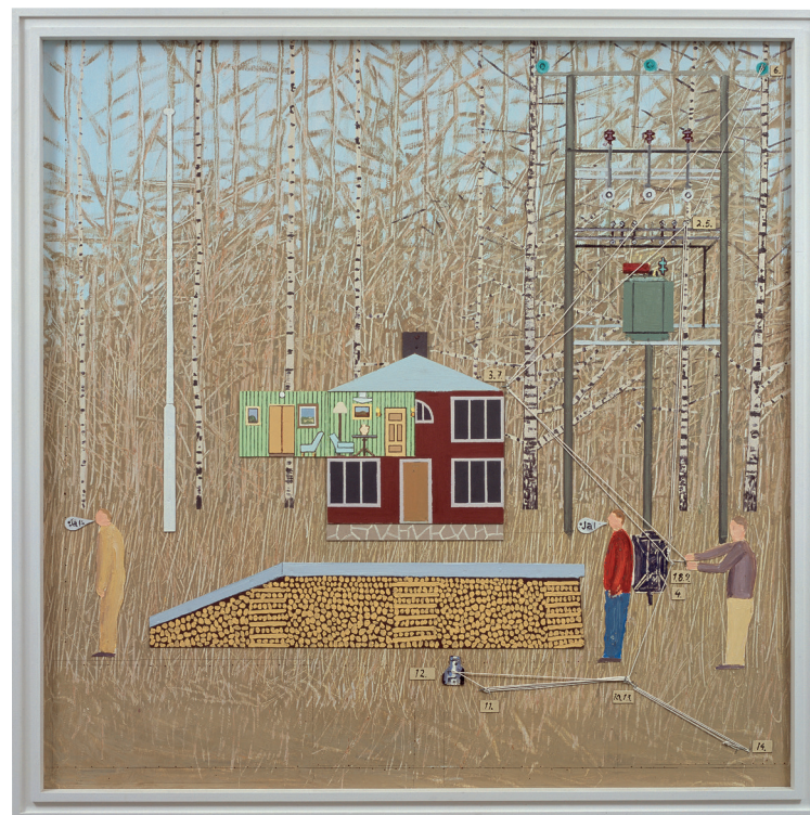
Figurer og handlinger i vårskogen, 2003-2004 Astrup Fearnley-samlingen